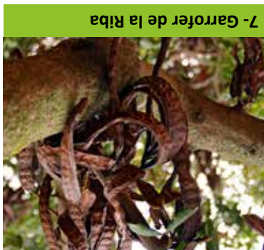
7- Garrofer de la Ribba