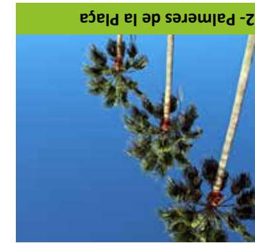
2- Palmeres de la Plaça