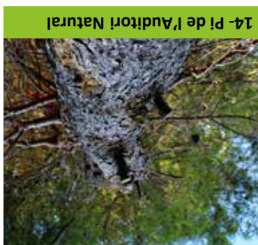
14- Pl de l'Auditori Natural