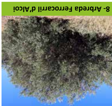
8- Arbreda Ferrocarri d'Alcoi