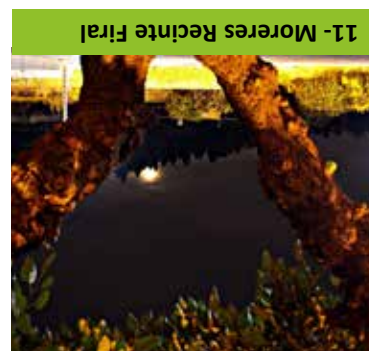
11- Moreses Recinte Firal