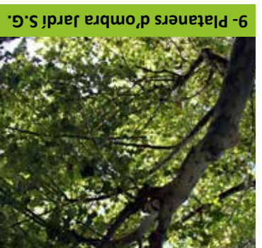
9- Plataners d'ombra Jardí S.G.