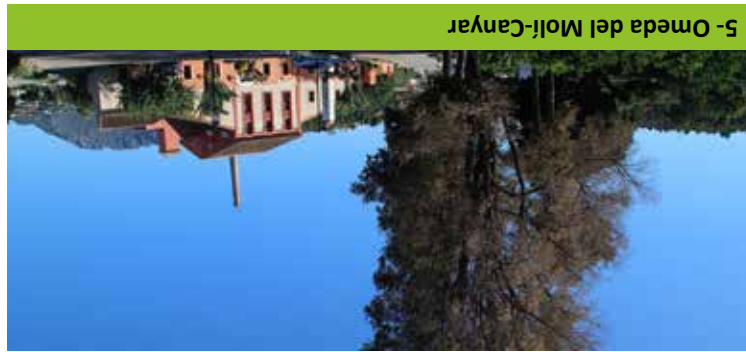
5- Omeda del Moll-Canyar