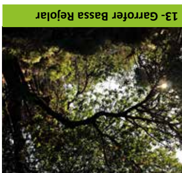
13- Garrofer Bassa Rejolar