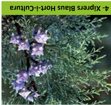
4- Xiprers Blaus Hort-i-Cultura