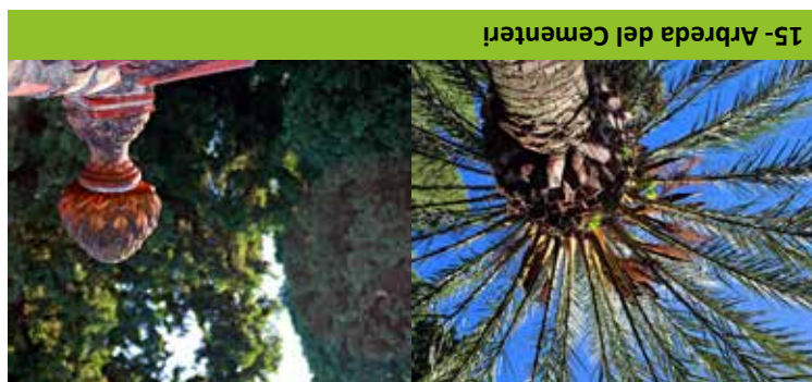
15- Arbreda del Cementeri

Patronat Provincial de Turisme de València