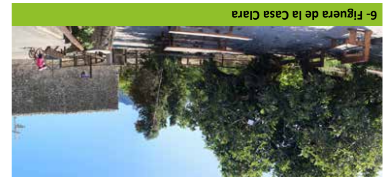
6- Figuera de la Casa Clara