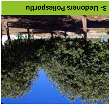
3- Lledoners Poliesportiu