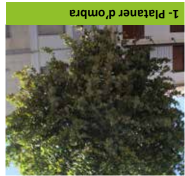
1- Plataner d'ombra