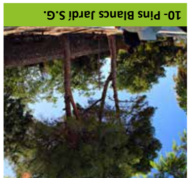
10- Pins Blancs Jardí S.G.